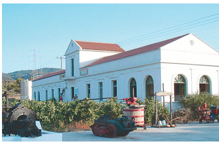
Οινοποιία Αναστασίας Τριανταφύλλου

Υπάρχουν δύο δρόμοι για να φτάσει κανείς στις Πεταλούδες. Είτε από το Θεολόγο στα δυτικά είτε από την Ψίνθο στα ανατολικά και σχεδόν όλοι οι επισκέπτες κάνουν όλη αυτή τη διαδρομή στο πλαίσιο της περιήγησής τους στο νησί και ως εκ τούτου θα περάσουν αναγκαστικώς μπροστά από το οινοποιείο που βρίσκεται στο δυτικό κλάδο της προς Θεολόγο.