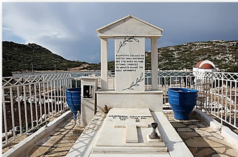
Τάφος «Κυρά της Ρω», στην βραχονησίδα Ρω.

Έχει τιμηθεί με παράσημα από πολλούς φορές. Τον Σεπτέμβριο του 1975, το Υπουργείο Εθνικής Αμύνης έστειλε ναυτικό άγημα και της δόθηκε μετάλλιο για τις « προσφερθείσες εθνικές τις υπηρεσίες» κατά την περίοδο της Κατοχής 1941-1944 (Κυριάκος Μ. Χονδρός, Καστελλόριζο, 1977).